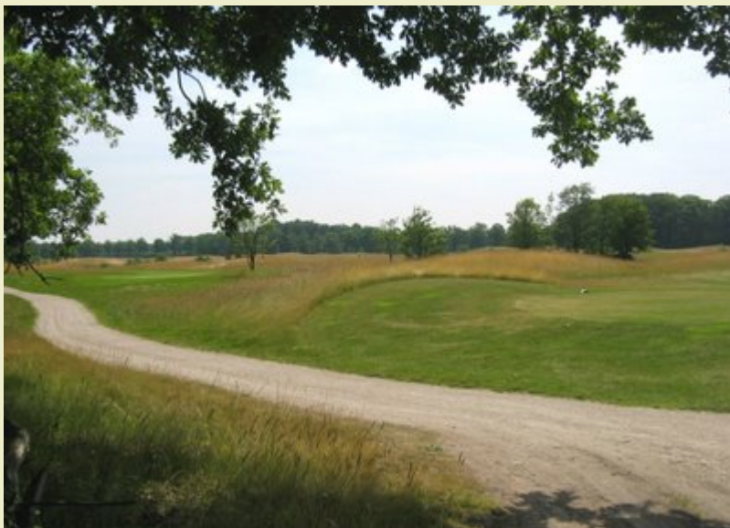
Tussen Kp47 en KP99 in Esbeek : Golfclub 'Midden-Brabant'