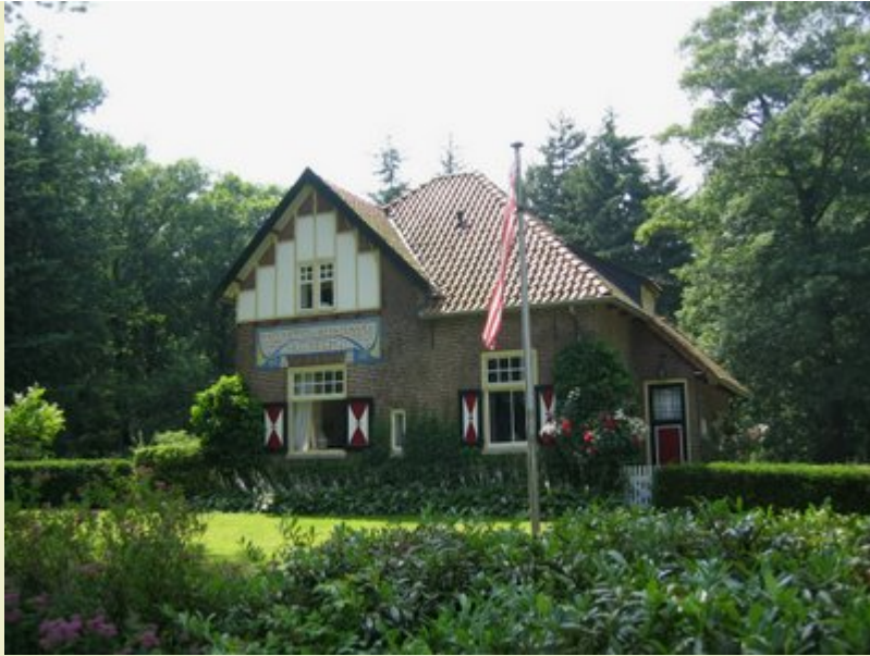
KP99 in Esbeek aan de N269: Landgoed 'De Utrecht'