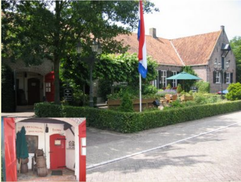
Baarschot: 'Monumentale Brouwerij'