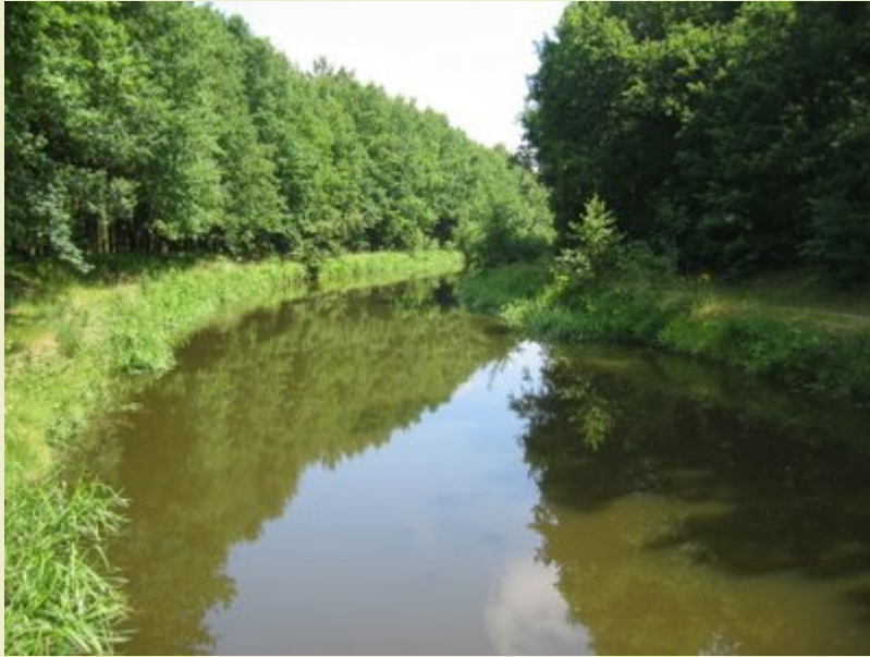
KP20: 'De Beerze' in Oirschot

Tussen KP98 en KP28: 'Het Goor' in de 'Neterselse Heide'