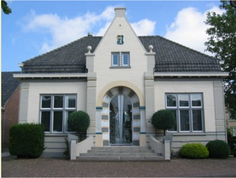
Lage Mierde : voormalig gemeentehuis