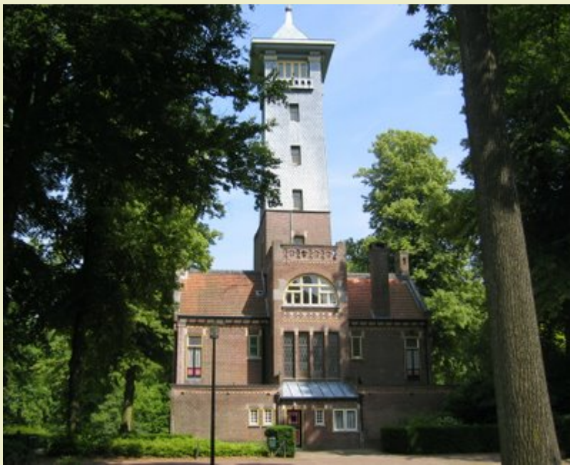
Brandtoren Landgoed 'De Utrecht'