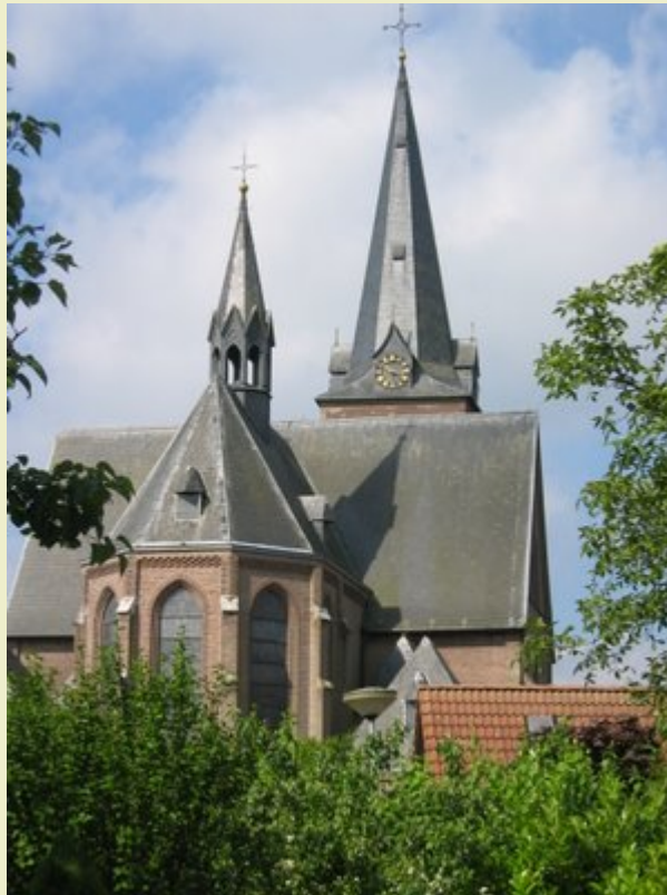
Lage Mierde : Sint-Stefanuskerk